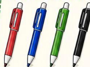
Rossa Blu Verde Nera