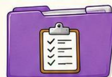
1 cartelletta per le VERIFICHE