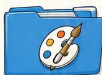
1 cartelletta per ARTE